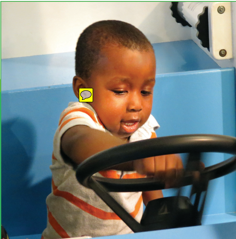
Driving a bus at the Children's Museum of Manhattan Manejando un autobús en el Museo de Niños de Manhattan