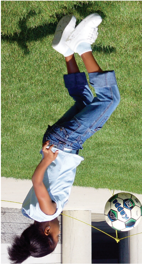
Tiempo de pantalla excesivo deja menos tiempo para, el juego creativo activo.

estudiantes de primaria con televisores en sus habitaciones tienden a rendir menos en los exámenes que los que no tienen televisores en sus habitaciones.