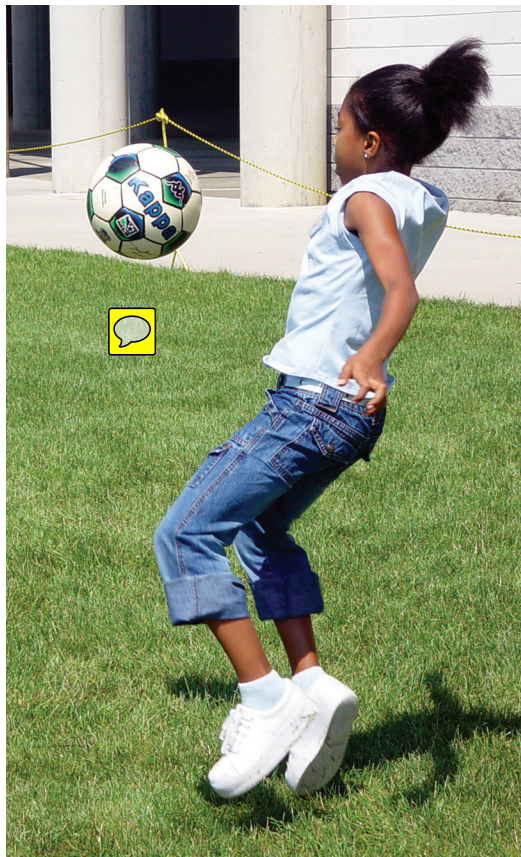
Excessive screen time leaves less time for active, creative play.